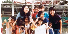
フィリピンでの体験