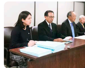
裁判後の記者会見